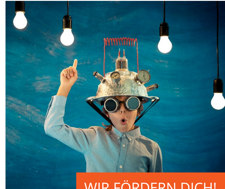
WIR FÖRDERN DICH!

Begabtenförderung von Klasse 5 bis zum Abitur